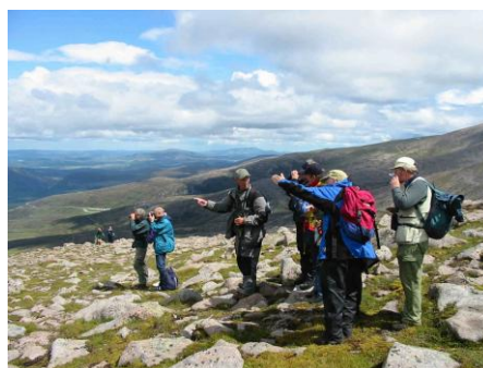
De første fjeldryper er set

Dags tur til Cairngorm Mountains et fjeldområde ikke ulig Nordskandinavien. På vejen til vort udgangspunkt for dagens fjeldvandring gjorde vi stop ved Loch Pityoulish og Loch Morlach. Vel fremme delte gruppen sig, i det de ca. 12 km fjeldvandring med en stigning fra ca. 500 m til ca. 1.200 m hvor de sidste 100 meters stigning var med en hældning på 45 grader var et valgfrit tilbud. De der ikke ville med på vandreturen tog først med en funicular bane til et udsigtsplateau i 1.100 meters højde. Derefter kørte de med bussen til Loch Morlach for gåtur ved søen. Gruppens flertal 15 gik, dog faldt 4 fra undervejs da det begyndte at regne, den ca. 7 timer lange fjeldtur til plateauet Cairn Lochan i 1215 meters højde. Her mødte vi Kathy en biolog i gang med et forskningsprojekt, hun efter lidt nødning viste os til et sted hvor der fortsat var en del pomeransfugle, de fleste af områdets ynglefugle havde forladt Cairngorm efter at en kraftig snestorm få dage før vor ankomst havde ødelagt reder med æg og dræbt de allerede udrugede unger. Snestormen havde også høstet kraftigt blandt fjeldryper kyllingerne.