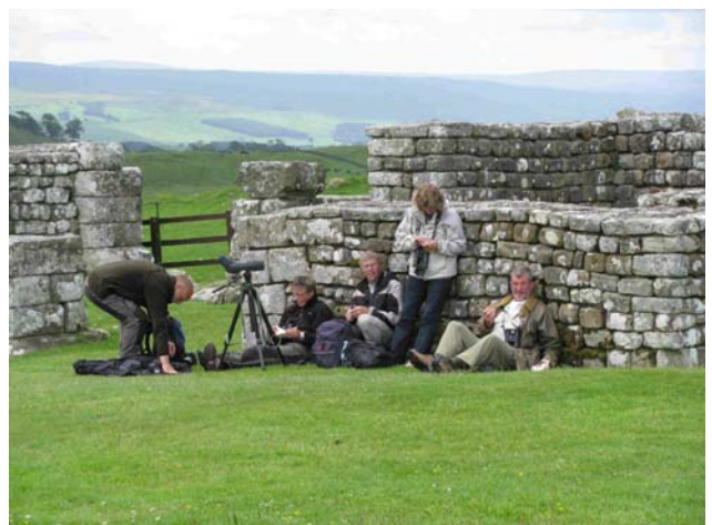
Frokost ved Hadrians mur