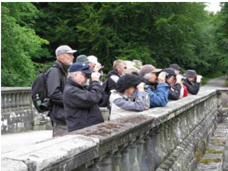
OBS efter vandstær og bjergvipstjert

Stor skallesluger, Spurvehøg, Strandskade, Mudderklire 4, Landsvale, Bysvale, Sortrygget vipstjert, Bjergvipstjert, Gærdesmutte, Vandstær, Rødhals, Sangdrossel, Skovsanger, Fuglekonge, Sortmejse, Blåmejse, Træløber, Gråkrage 2, Sortkrage, Bogfinke, Grønirisk, Grønsisken, Dompap