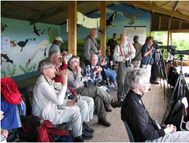
Frokost i skjul - RSBP Vane Farm.

Vi fortsatte til Loch Leven og det 230 hektar store RSBP reservat Vane Farm, hvor vi ud over OBS i reservatet spiste frokost og skiftede bus.