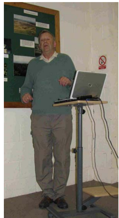
Malcolm Ogilvie - en levende fortæller.

Efter aftensmaden, som vi fik på Port Charlotte Hotel, var der som dagens sidste programpunkt arrangeret foredrag af den internationalt kendte ornitolog og forfatter Malcolm Ogilvie, der levende berettede om fuglelivet på Islay året rundt og øens betydning som overvintringssted for blandt andet de østgrønlandske bestande af bramgæs og lysbugede knortegæs.