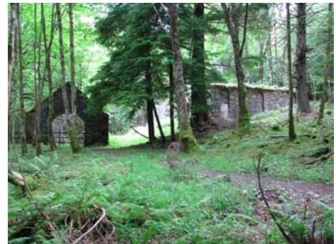
Ruiner i skoven ved slottet