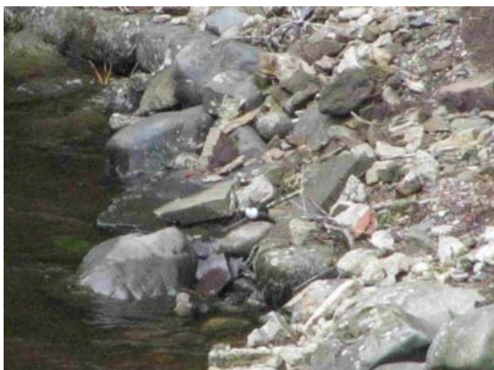
Vandstæren der blev set fra broen.