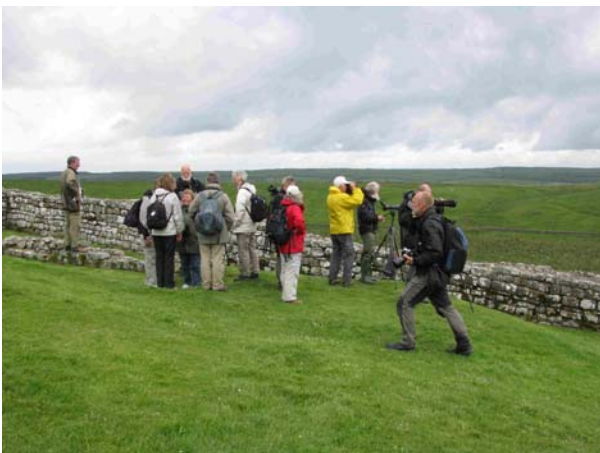
OBS ved Hadrians mur

Knopsvane, Sangdrossel, Mursejler, Gærdesmutte, Rødhals, Gulspurv