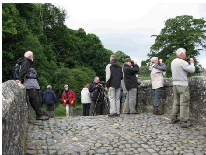
OBS! ved River Doon fra 'Brig O'Doon' der var frelsen for Tam O'Shanter, hovedpersonen i det vel nok efter Auld Lang Syne mest kendte digt skrevet af Skotlands nationalskjald.

Dette at være i Ayrshire var så muligheden for at komme til hedeområder, hvor der med sikkerhed skulle være Red Grouse, men af alle dage var de områder, vi skulle have været til spærret på grund af rally. Så vi startede i blandings vejr, lidt skyet med lidt regn og nogen sol i Alloway Robert Burns fødeby i dag en sydlig forstad til Ayr, hvor der langs floden Doon og ved dens udløb er nogle fremragende lokaliteter. Nogle fik også besøgt det lokale Robert Burns center. Hvor meget var at købe. Efter et par timer kørte vi langs floden til Loch Bogton ved Dalmellington og fortsatte ca. 1 time senere til Carsphairn i et viljefast skønt resultatløst forsøg på at finde Red Grouse. Næste stop blev gjort ved Loch Ken hvor blandt andet et par røde glente livede lidt op på humøret. Herefter gik turen videre til dagens endemål Graham Arms Hotel i byen Longtown lidt nord for Carlisle.