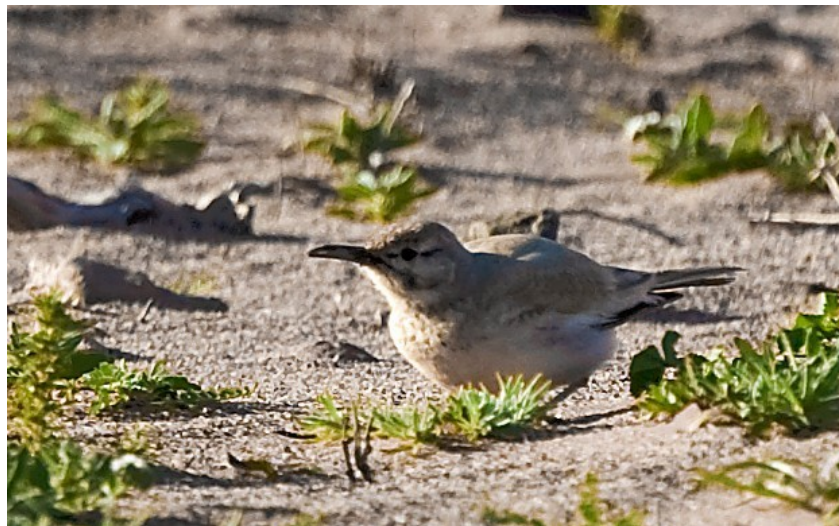
Hærfuglelærke / Carl Erik Mabeck

23/1 i alt 4 ved km 33-35 sydvest for Guelmine. Næsten alle syngende.