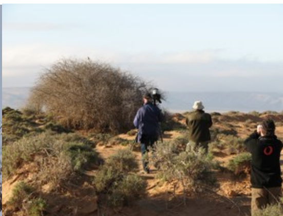
fotografer på jagt