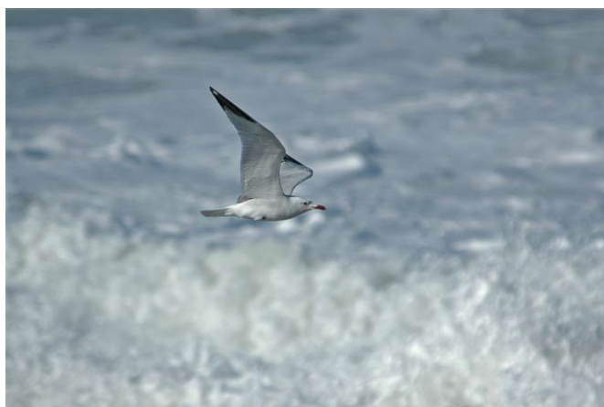
Audouinsmåge over brænding / Jens Ballegaard