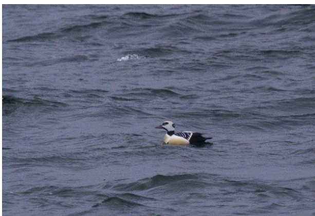
Stellersand han: Vagn