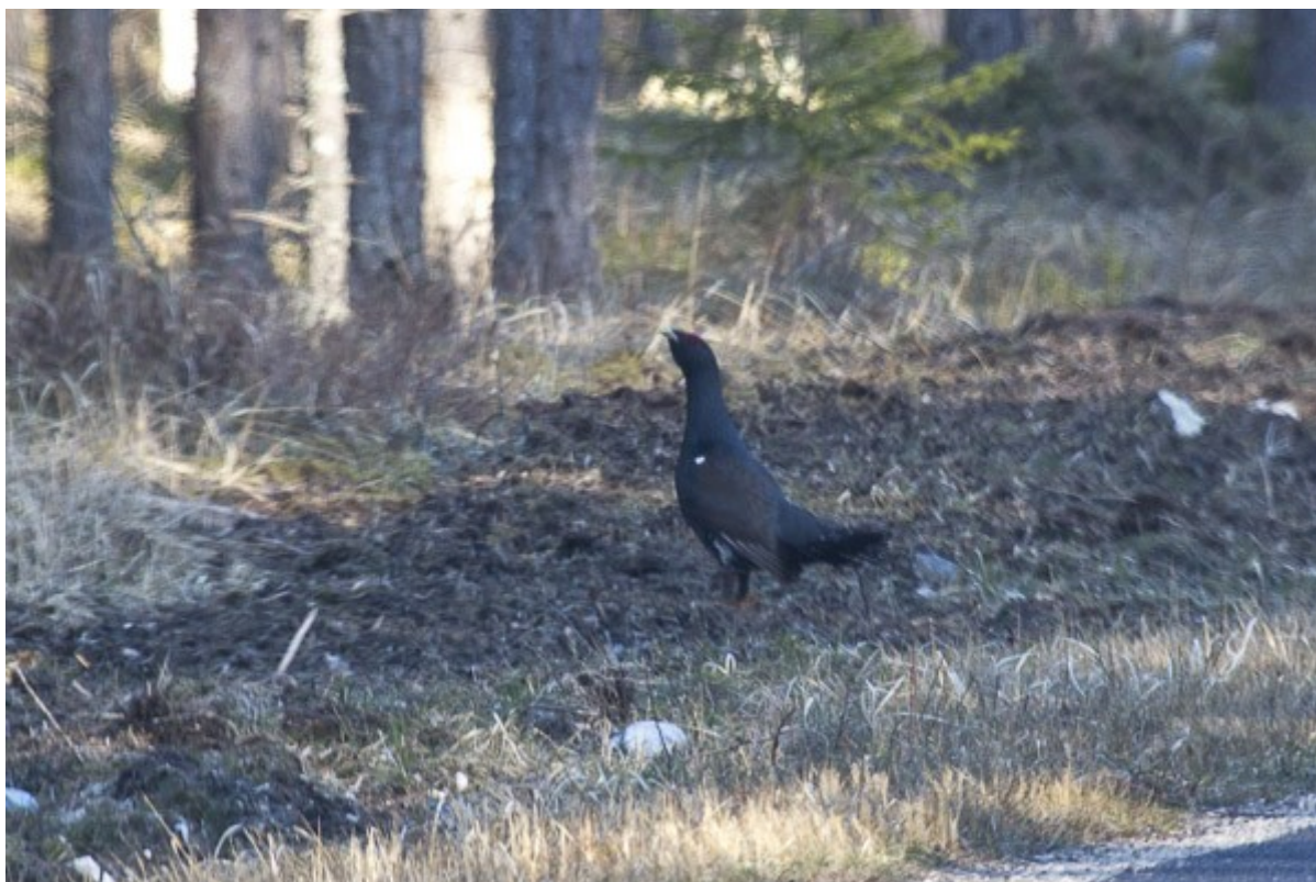
Tjur han: Vagn