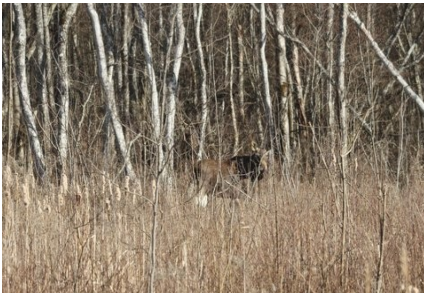
Ung elg: Ingelise