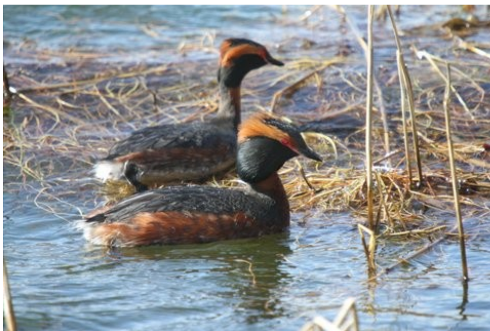
Nordiske lappedykkere: Ingelise